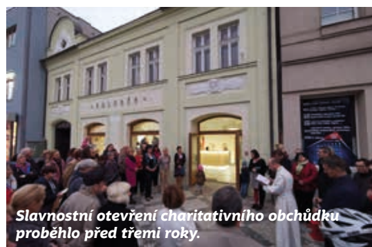
Slavnostní otevření charitativního obchůdku proběhlo před třemi roky.