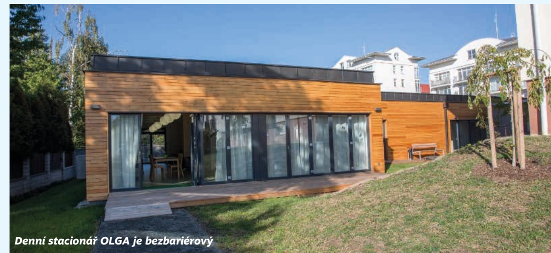
Denní stacionář OLGA je bezbariérový

Odbor sociální věcí a zdravotnictví najdete na Komenského náměstí 1850 (v budově vedle DPS Senior). Kontakt: 323 618 241