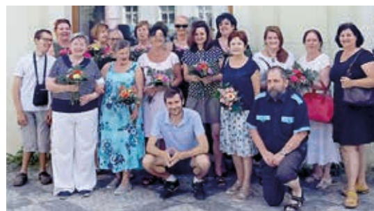
KOLOBĚH může fungovat díky obětavé práci dobrovolníků